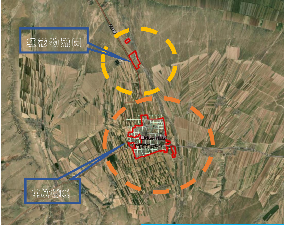
红花物流产业园（规划范围）