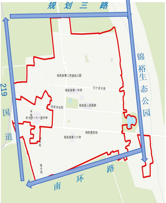
中 心 城 区 (规划范围)