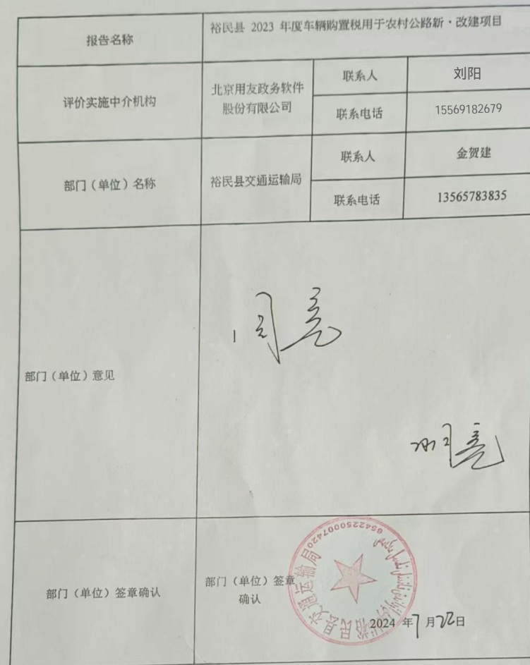
绩效评价报告意见反馈表