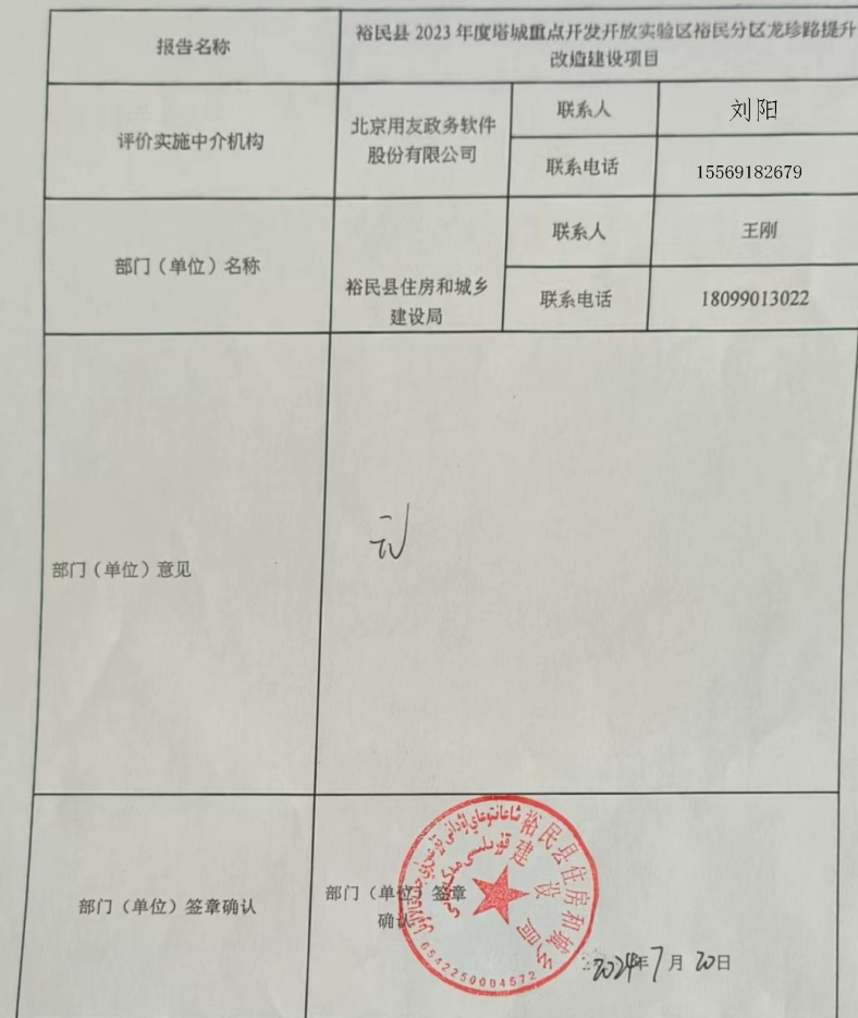
绩效评价报告意见反馈表