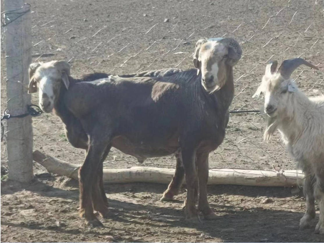
附件四：项目现场照片